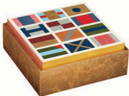
Caixa 'Théorème Hippique Graphique' em madeira lacada pintada à mão, preço sob consulta, HERMÈS