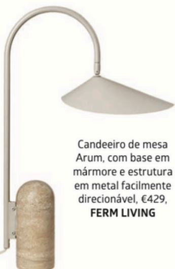
Candeeiro de mesa Arum, com base em mármore e estrutura em metal facilmente direcionável, €429, FERM LIVING