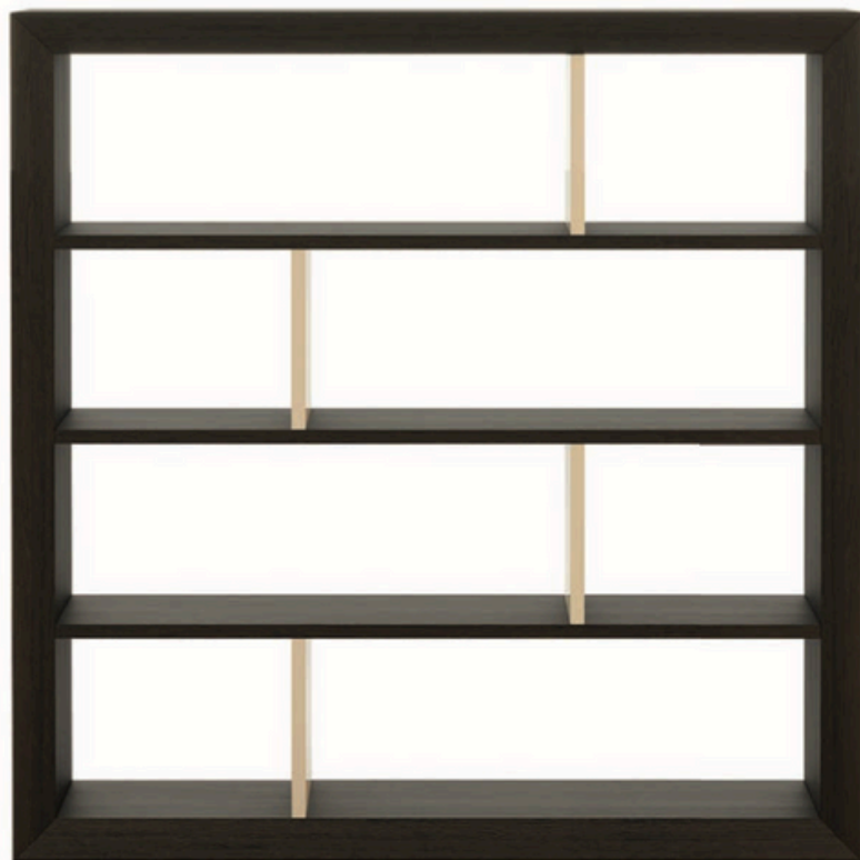
Estante Kensington, em madeira, com 200 x 200 cm, preço sob consulta, STYLISH CLUB