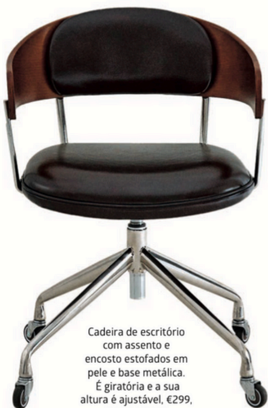
Cadeira de escritório com assento e encosto estofados em pele e base metálica. É giratória e a sua altura é ajustável, €299, ZARA HOME