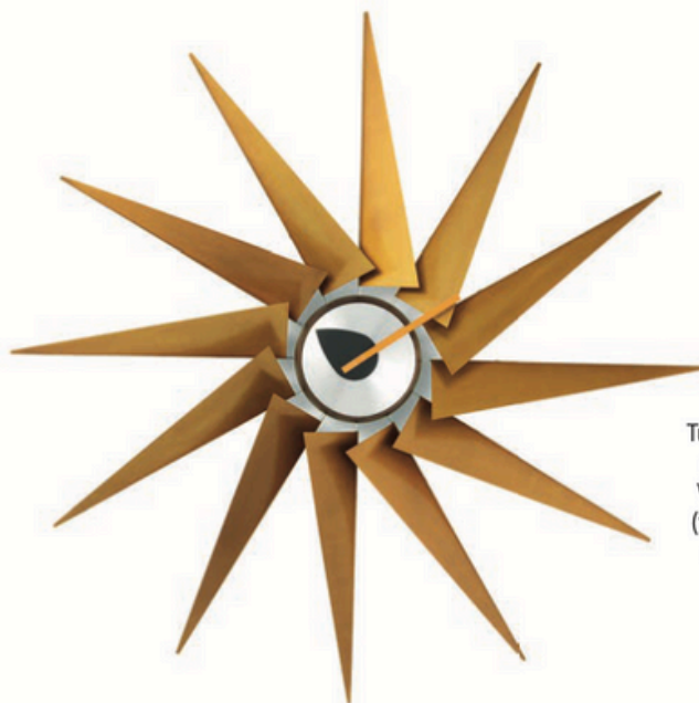
Turbine Clock da coleção Wall Clocks (1949-1960), de George Nelson, €706,50, VITRA

O ESPAÇO DE TRABALHO EM CASA DEIXOU DE SER UM CANTO IMPROVISADO PARA SE TORNAR PARTE INTEGRANTE DA VIDA CONTEMPORÂNEA, A MENOS QUE, CLARO, ESSA SEJA A ÚNICA OPÇÃO. POIS MAIS DO QUE RESPONDER A NECESSIDADES FUNCIONAIS, O HOME OFFICE REFLETE HOJE, MAIS QUE NUNCA, A IDENTIDADE DE QUEM O UTILIZA, INTEGRANDO-SE NO DESENHO DA CASA COM A MESMA ATENÇÃO DADA A UMA SALA DE ESTAR OU A UM QUARTO.