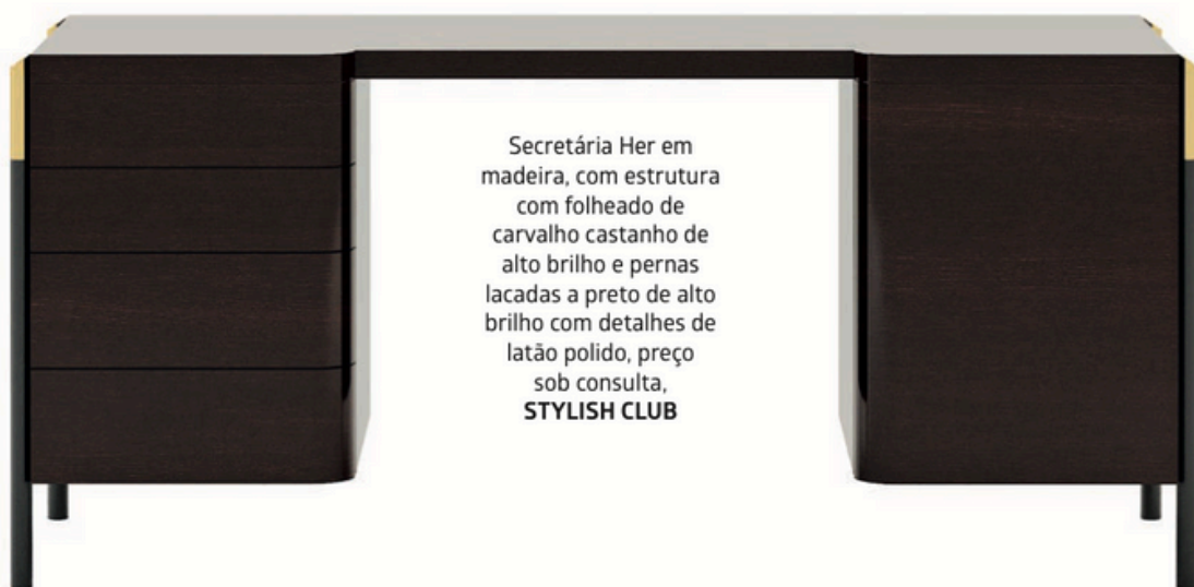
Secretária Her em madeira, com estrutura com folheado de carvalho castanho de alto brilho e pernas lacadas a preto de alto brilho com detalhes de latão polido, preço sob consulta, STYLISH CLUB

O ESPAÇO DE TRABALHO EM CASA DEIXOU DE SER UM CANTO IMPROVISADO PARA SE TORNAR PARTE INTEGRANTE DA VIDA CONTEMPORÂNEA, A MENOS QUE, CLARO, ESSA SEJA A ÚNICA OPÇÃO. POIS MAIS DO QUE RESPONDER A NECESSIDADES FUNCIONAIS, O HOME OFFICE REFLETE HOJE, MAIS QUE NUNCA, A IDENTIDADE DE QUEM O UTILIZA, INTEGRANDO-SE NO DESENHO DA CASA COM A MESMA ATENÇÃO DADA A UMA SALA DE ESTAR OU A UM QUARTO.