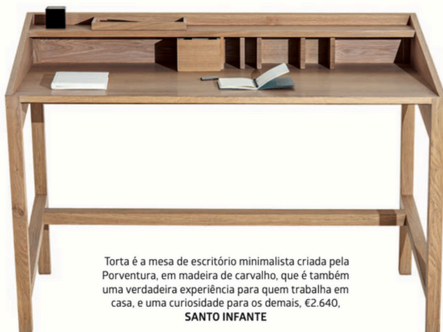
Torta é a mesa de escritório minimalista criada pela Porventura, em madeira de carvalho, que é também uma verdadeira experiência para quem trabalha em casa, e uma curiosidade para os demais, €2.640, SANTO INFANTE

Um home office deve ser confortável, mas sem se confundir com uma sala de estar. Cadeiras ergonómicas, mesas à altura correta e iluminação bem posicionada criam um espaço funcional que respeita o corpo e promove o bem-estar ao longo do dia. O segredo está em encontrar o equilíbrio: suficientemente acolhedor para passar horas a fio, mas estruturado o bastante para manter o foco e evitar distrações. A ideia é mesmo que o facto de estar em casa não seja um motivo para se distrair, ou acomodar em demasia.